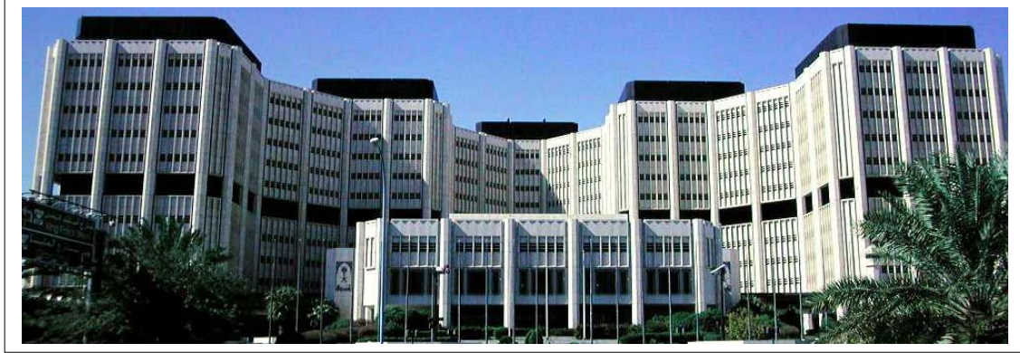
شكل ١ نموذج لبيان ترقيم ورسم الأشكال